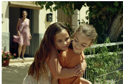
Mentiste Amanda , Roel de Oro